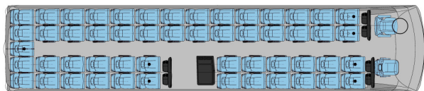
Maximální obsaditelnost u 12,20 m 53 * sedadel s WC + průvodce + řidič