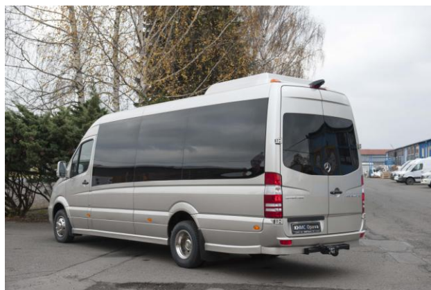
Fotografie jsou pouze ilustrační, mohou být zobrazeny příplatkové obce, které nejsou součástí dané nabídky