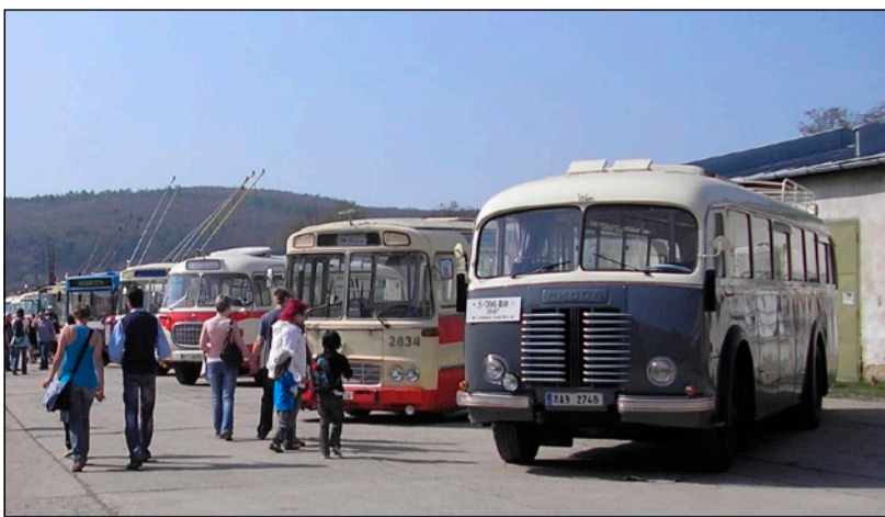
▲ Z loňského Dne otevřených dveří v depozitáři Technického muzea Brno v areálu bývalých kasáren v Řečkovicích.

Vozidla z depozitářů kolejových i nekojových vozidel se každoročně účastní tradičních brněnských událostí, kde jsou nasazována na mimořádné linky určené pro návštěvníky těchto akcí. Připomeňme, že brněnská muzejní noc