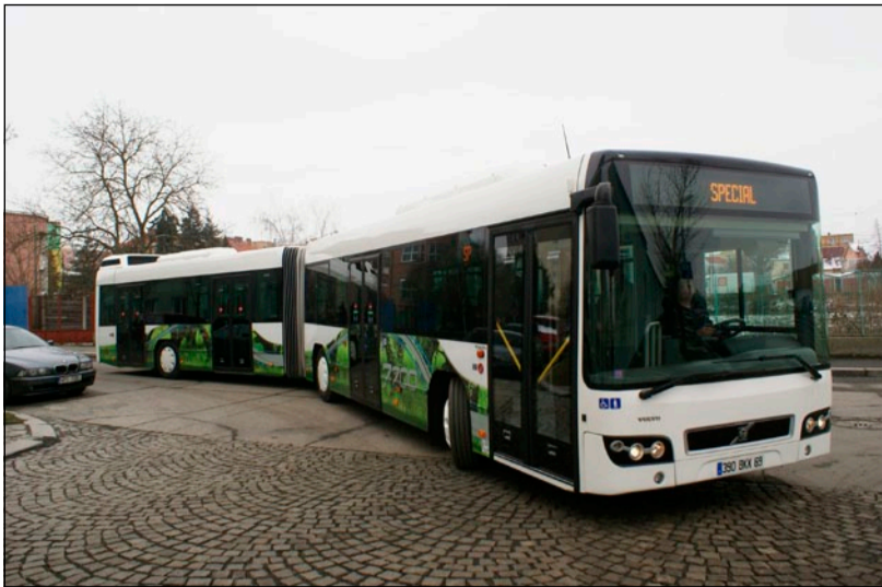
► Z prezentace a předváděcí jízdy kloubového nízkopodlažního autobusu Volvo 7700 v Plzni.

Kloubový autobus Volvo se v České republice objevuje poprvé (městské autobusy 7000 a 7700 standardní délky jezdí např. v Kroměříži), a do Česka byl dopraven z Francie. V plzeňském ČSAD se s ním měli možnost důkladně seznámit, a to včetně zkušební jízdy po okolí města, zástupci managementu i zaměstnanci dopravního útvaru. Prezentovaný autobus v nadstandardním vybavení interiéru je osazen šestiválcovým naftovým motorem Volvo D9B splňujícím emisní normu Euro 5, o zdvihovém objemu 9 363 cm 3 , výkonu 228 kw (310 HP) při 2200 ot/min, max. točivém