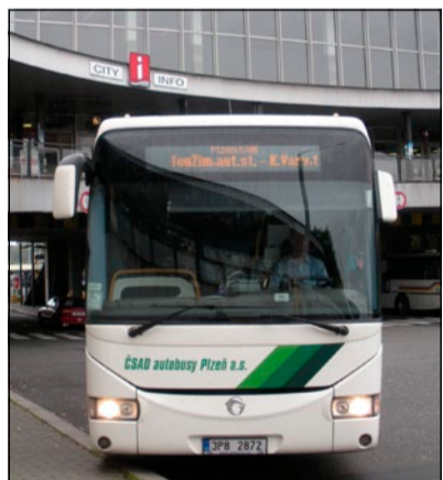
▲ Autobus plzeňského ČSAD na terminálu v Karlových Varech.

„DPÚK rozhodnutí Nejvyššího soudu o zamítnutí dovolání respektuje a jako svůj oficiální název používá jen čtyři velká písmena. Spor spíše chápeme jako pokračování nezákonného jednání ze strany Ústeckého kraje při plánované likvidaci společnosti a zároveň také jako nástroj pro platbu desetimilionových částek externím právníkům na úkor daňových poplatníků.“ (r)