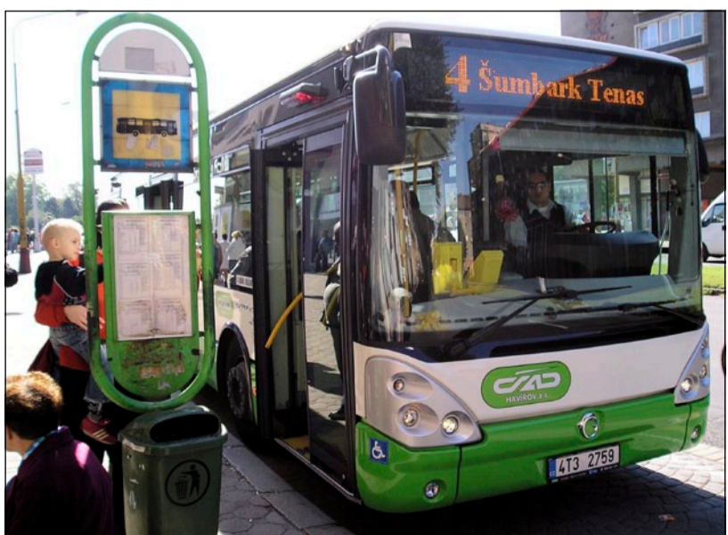
▲ Peníze z ROP Moravskoslezsko jsou využívány i pro modernizaci městských hromadných dopravních v krajích. Dotace na pořízení autobusů získala i společnost ČSAD Haviřov, která provozuje MHD v Haviřově...