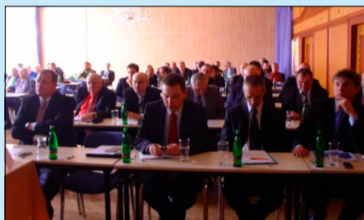
► Částečný záběr na účastníky jednání valné hromady SD ČR.

na operační programy fondů EU, plnění Dohody mezi státem a plynárenskými společnostmi o podpoře CNG v dopravě a chystané reformy.